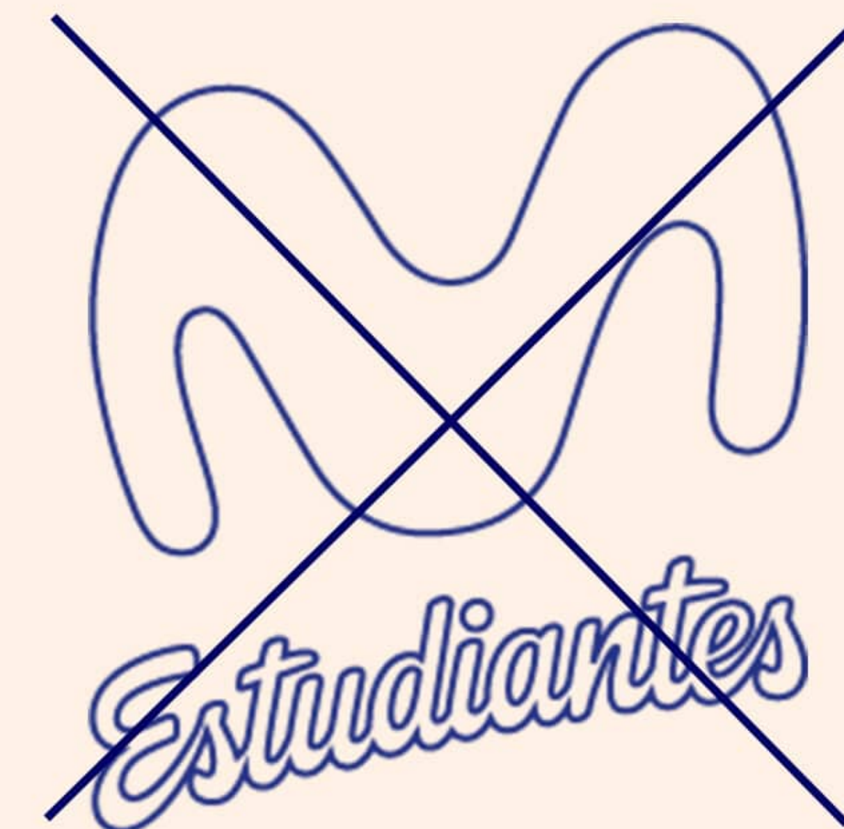
Logo solo contorno